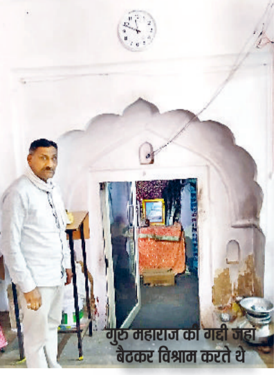
गुरु महाराज को गद्दी चढ़ा बैठकर विश्राम करते थे