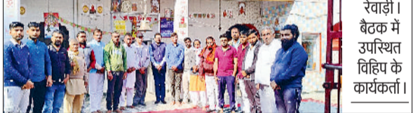
रेवाड़ी। बैठक में उपस्थित विधिव के कार्यकर्ता।