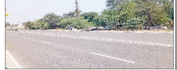
रेवाड़ी। एम्स तक यातायात के लिए फिलहाल इस अंडरपास से है रास्ता, इन रेलवे लाइनों को क्रॉस करने के लिए बनाया जाएगा आरओबी, एनएच-11 के इस हिस्से से एम्स तक होगा आरओबी का निर्माण।

बजट में संशोधन करना आड़े आ रहा है। संशोधित बजट को इसी माह स्वीकृति प्रदान किए जाने की पूरी संभावना है। सूत्रों के अनुसार एम्स का शिलान्यास जल्द कराने के लिए सरकार और भाजपा का शीर्ष नेतृत्व एक्टिव हो गया है। ऐसा माना जा रहा है कि पीएम मोदी एम्स का शिलान्यास जनवरी माह में करेंगे। इसी दिग्दर्शन में एम्स का बिल जल्द कैबिनेट में पास कर सकते हैं। इसके बाद एम्स की बिल्डिंग का निर्माण कराने की प्रक्रिया को जल्द शुरू किया जाएगा। एम्स की बिल्डिंग का निर्माण कराने के लिए वर्क ऑर्डर जारी करने में हो रही देरी के पीछे