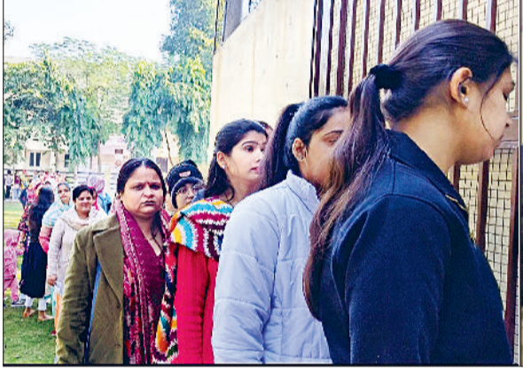
रेवाड़ी। बायोमेट्रिक वेरिफिकेशन कराते हुए व हिंदू स्कूल में लगी अभ्यर्थियों की कतार।