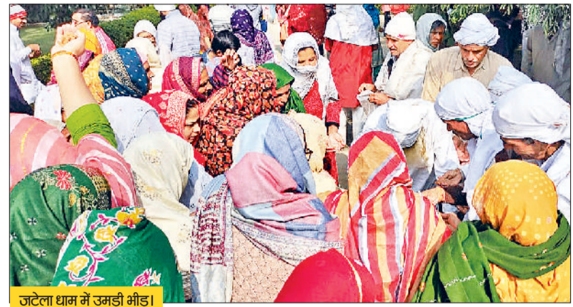
जटेला धाम में उमड़ती भीड़।