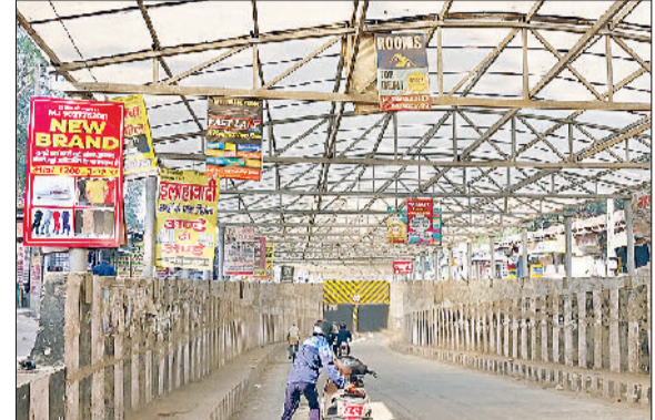
रेवाड़ी। अंडरपास में लगे हुए अवैध होर्डिंग व अंडरपास का टूटा पड़ा डिवाइडर।

नई योजना के शुरू होने के पश्चात उसकी देखरेख पर ध्यान नहीं देना प्रशासन की आदत में शुमार हो गया है। लोगों की सुविधा के लिए सितंबर 2021 में शुरू हुए शहर के डबल फाटक अंडरपास में कई समस्याएं पैदा होने लगी हैं। क्षतिग्रस्त हो रही सड़क, डिवाइडर और दीवारों पर कोई ध्यान नहीं दिया जा रहा है। करीब 24 करोड़ रुपये की लागत से बने अंडरपास में लाइटों होने के बावजूद भी दिन के समय अंधेरा व्याप्त रहता है। लाइटों को अभी तक चालू तक नहीं किया गया है, जिसके कारण चालकों को दिन में भी वाहनों की लाइटों का सहारा लेना पड़ रहा है। अंधेरा होने के कारण अंडरपास से तेज गति से गुजरते वाहनों से कभी भी दुर्घटना हो सकती है। अंडरपास में बने फुटपाथ की टाइलें भी जगह-जगह से गायब हो चुकी हैं।