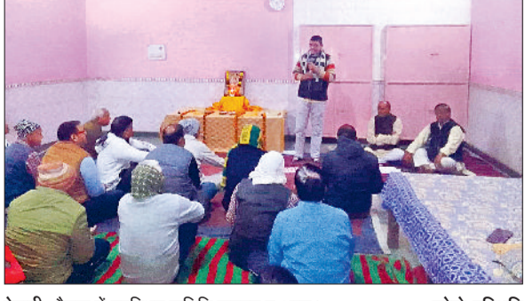
रेवाड़ी। बैठक में उपस्थित समिति सदस्य व अन्य।

बालाजी धर्मार्थ समिति की ओर से संचालित शिव मंदिर आजाद चौक में रविवार को अयोध्या में बने श्री राम मंदिर में प्राण प्रतिष्ठा के उपलक्ष्य में कार्यक्रम को लेकर बैठक आयोजित की गई। बैठक में समिति सहित अनेक गणमान्य व्यक्तियों ने भाग लिया। समिति ने मंदिर में 22 जनवरी को होने वाले कार्यक्रम के रूपरेखा तैयार की। समिति पदाधिकारियों ने घरों में अयोध्या से आए पीले चावल,