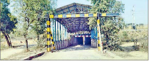
रेवाड़ी। एम्स तक यातायात के लिए फिलहाल इस अंडरपास से है रास्ता, इन रेलवे लाइनों को क्रॉस करने के लिए बनाया जाएगा आरओबी, एनएच-11 के इस हिस्से से एम्स तक होगा आरओबी का निर्माण।

लोकसभा चुनावों का आगाज होने के साथ ही माजरा में बनने वाले एम्स को लेकर हलचल तेज हो रही है। एम्स के लिए केंद्रीय कैबिनेट में संशोधित बजट पास होने के बाद इसके निर्माण का रास्ता साफ होगा। सीएम मनोहरलाल ने कैबिनेट मंत्री डा. बनवारीलाल की एम्स को रेवाड़ी-जैसलमेर नेशनल हाइवे-11 से जोड़ने के लिए रेलवे ओवरब्रिज की मांग को प्रशासनिक स्वीकृति प्रदान कर दी है। इस ओवरब्रिज के निर्माण पर करीब 200 करोड़ रुपये खर्च होने का अनुमान है। जनवरी माह में क्षेत्र की जनता को एम्स के शिलान्यास का तोहफा मिलने के पूरे आसार हैं। एम्स शिलान्यास के साथ ही पीएम मोदी एनएच-152डी भी जनता को समर्पित करेंगे। केंद्र सरकार की ओर से वर्ष 2019 में मनेठी में एम्स की स्वीकृति प्रदान करने के साथ ही 1299 करोड़ रुपये