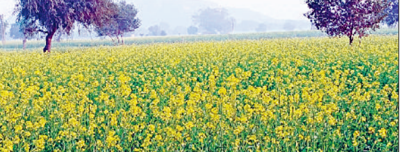
रेवाड़ी। एक खेत में लहलहाती सरसों की फसल।

दिसंबर माह के दूसरे पखवाड़े में भी मौसम में खास बदलाव नहीं आया है। तापमान में मामूली वृद्धि होने के साथ एक्वूआई में काफी सुधार हुआ है, जिससे प्रदूषण की समस्या कम हो गई है। 19 दिसंबर से आसमान में आंशिक बादल छाने की संभावना जताई जा रही है। इसके बाद घना कोहरा और ठंड अपना असर दिखाएंगे। फसलों के लिए मौसम पूरी तरह अनुकूल माना जा रहा है। बरसात के जल्द आसार नजर नहीं