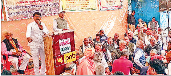
रेवाड़ी। महापंचायत में लोगों को संबोधित करते वक्ता।