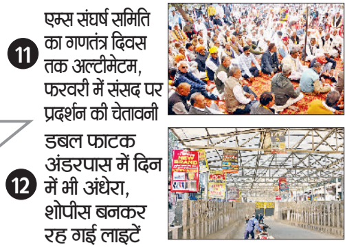
11 एम्स संघर्ष समिति का गणतंत्र दिवस तक अल्टीमेटम, फरवरी में संसद पर प्रदर्शन की चेतावनी डबल फाटक अंडरपास में दिन में भी अंधेरा, शोपीस बनकर रह गई लाइटें