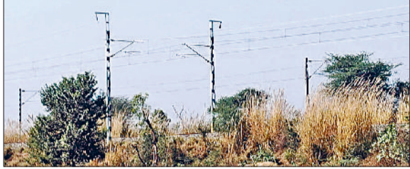
रेवाड़ी। एम्स तक यातायात के लिए फिलहाल इस अंडरपास से है रास्ता, इन रेलवे लाइनों को क्रॉस करने के लिए बनाया जाएगा आरओबी, एनएच-11 के इस हिस्से से एम्स तक होगा आरओबी का निर्माण।

के बजट का प्रावधान किया था। मनेठी में अरावली की जमीन होने के कारण किसानों की सरकार को जमीन देने की पहल पर यह प्रोजेक्ट माजरा में आ गया। सूत्रों के अनुसार पहले से तैयार किए गए अनुमानित बजट में महंगाई बढ़ने के कारण संशोधन की आवश्यकता है। केंद्र सरकार बजट में 25 फीसदी तक की वृद्धि का बिल जल्द कैबिनेट में पास कर सकती है। इसके बाद एम्स की बिल्डिंग का निर्माण कराने की प्रक्रिया को जल्द शुरू किया जाएगा। एम्स की बिल्डिंग का निर्माण कराने के लिए वर्क ऑर्डर जारी करने में हो रही देरी के पीछे